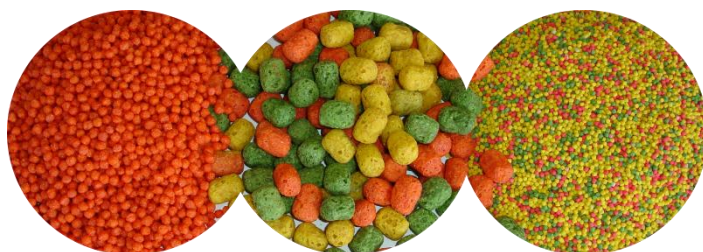
Alcon Club Trinca-ferro